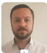
ONDŘEJ TOMŠEJ MINISTERSTVO PRŮMYSLU A OBCHODU